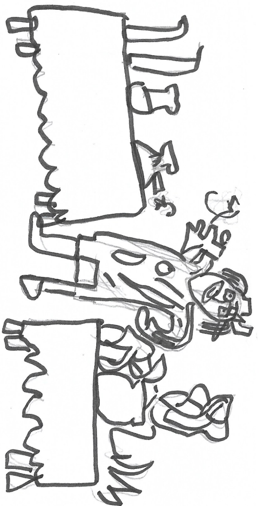
Le savant fou qui fait du feu